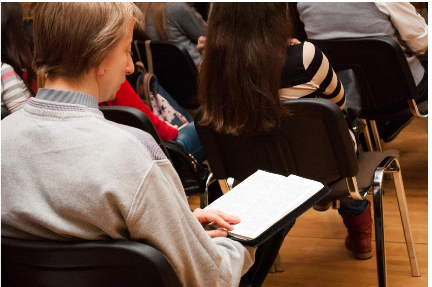
На молодіжному вечорі поклоніння «H2O – спрага за Богом».