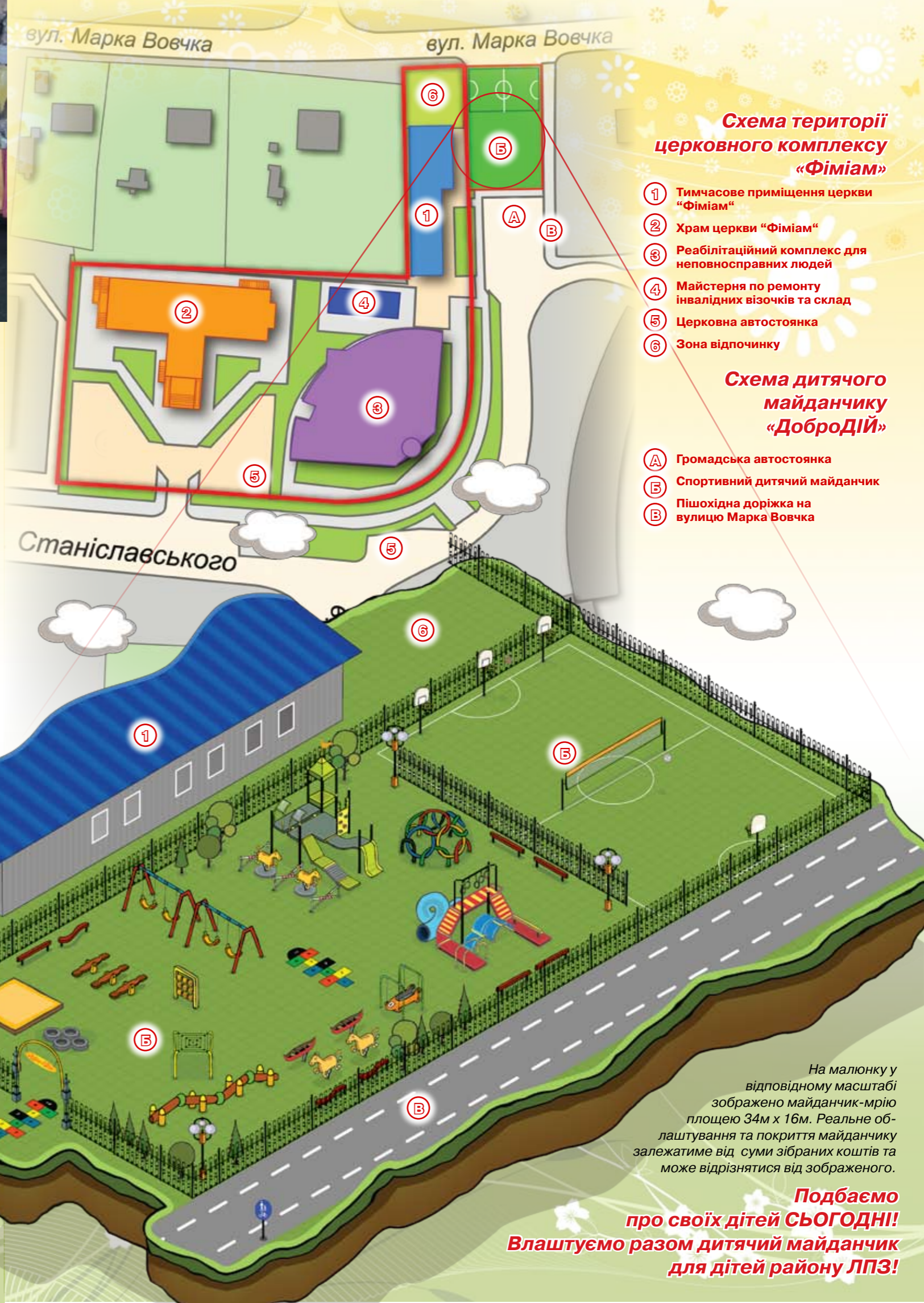
Схема території церковного комплексу «Фіміам»